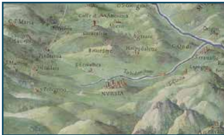
Galleria delle carte geografiche Vaticano. Rilievo di Egnazio Danti nel 1580. Stranamente viene riportato il fiume Torbidone fino a Serravalle (evidentemente in quell'anno il fiume era presente con una portata di acqua considerevole tanto da considerarlo il fiume principale).