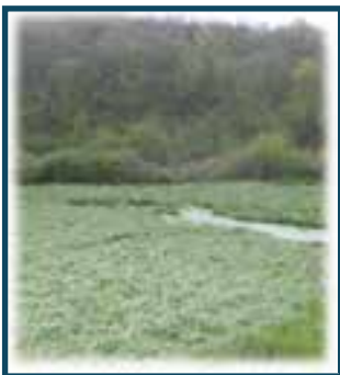
Le sorgenti del Torbidone