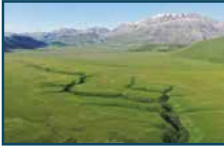
I Mergani – (Foto di Lorenzo Sgalippa)

Riguardo alla fecondità de' fiumi e la bontà delle fonti , così l'Autore prosegue: “ Qui io lodarò i suoi fonti e fiumi, non solo per causa delle saporite trotte che producono, ma etiandio per le comodità cittadine, come a macinare il grano, ad irrigare i campi, a lavare i panni... ” E più avanti